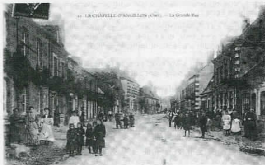
LA CHAPPELLE-D'ANGILLON (CIVIL) - La Grande Rue

Nous avons vivement souhaité accueillir sur notre territoire de petites entreprises qui vous auraient permis de trouver du travail sur votre lieu de résidence. Mais il faut voir les choses en face et